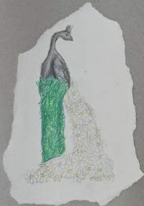
IDEA C: "Pavone" in bianco con profumato in verde - tutto con fiori