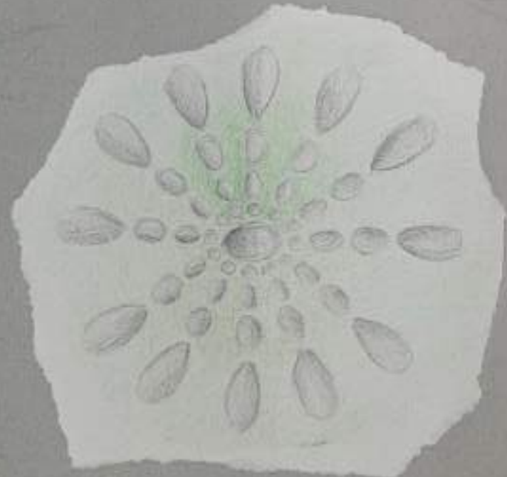
IDEA D: "Mistero" di bianco che rappresenta il simbolo della luce