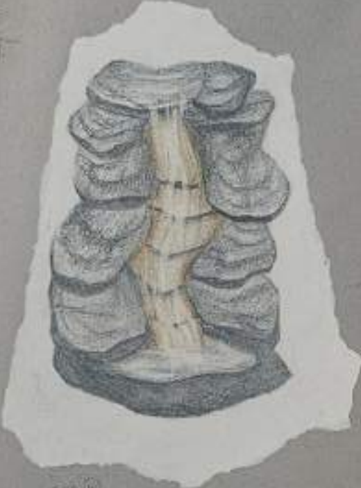
IDEA E: "Seduzione" in natura - naturale