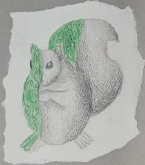
IDEA B: "Seduzione" nella natura - bianco, verde